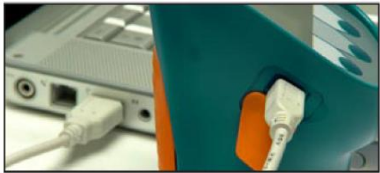
小型USB接口用于电脑下载数据