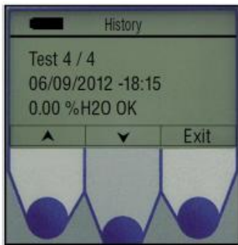
内置存储器可存储90个检测结果